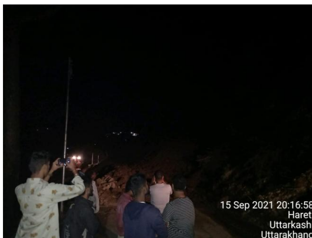
15 Sep 2021 20:16:58 Hareti Uttarkashi Uttarakhand

दिनांक 15.09.2021 को समय 7:24 यमुनोत्री राष्ट्रीय राजमार्ग पनोथ के पास मलवा आने के कारण मार्ग अवरुद्ध होने पर जनपद आपातकालीन परिचालन केन्द्र द्वारा राष्ट्रीय राजमार्ग खण्ड, बडकोट व अन्य सम्बन्धितों से समन्वय किया गया मार्ग को सुचारु करने हेतु 02 जे0सी0बी0 मशीन, 01 पोकलेण्ड मशीन द्वारा मार्ग को दिनांक 16.09.2021 प्रातः 11:00 बजे सुचारु करवाया गया।