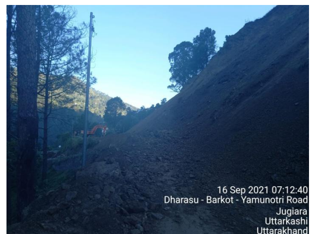
16 Sep 2021 07:12:40 Dharasu - Barkot - Yamunotri Road Jugiara Uttarkashi Uttarakhand