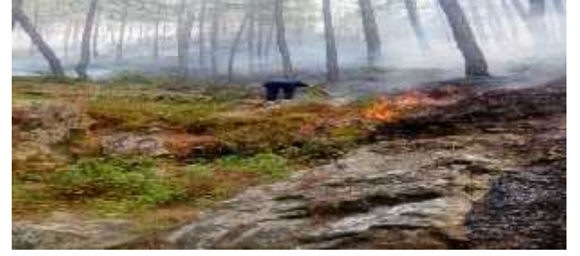
Latest Status of forest fire and Deployment of man power as on 20.06.2019 (Up to 10.00 AM) Distt. Uttarkashi

दिनांक दिनांक 15.6.2019 को बड़ोथी पोखू देवता मन्दिर के पास जंगल में आग लगने की सूचना प्राप्त हुई जिसमें QRT, फायर सर्विस, एस0डी0आर0एफ0, वन विभाग की टीम आग को नियंत्रण करने के लिए मौके पर तैनात रहें।